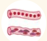
血液ドロドロ太りタイプ