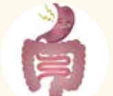
代謝低下太りタイプ