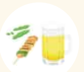
毒素ためこみ太りタイプ