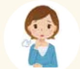
ストレス太りタイプ

なかなかダイエットをする勇気がなかった方も 最後のダイエットと思ってチャレンジしてみませんか？