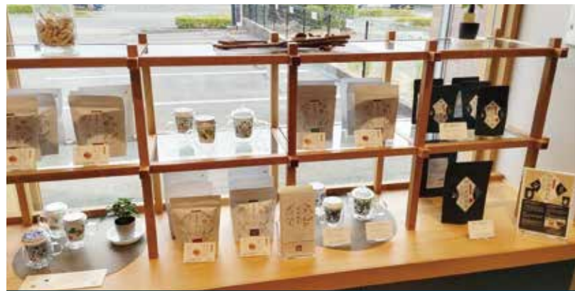
店内は、お茶や自然食品などのアイテムも扱っています。