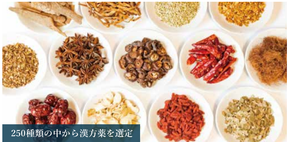
250種類の中から漢方薬を選定